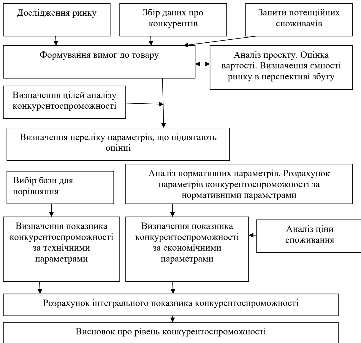
Рисунок 2.1 - Типова схема оцінки конкурентоспроможності підприємства

Після дослідження конкурентоспроможності підприємства згідно зазначених етапів, слід перейти до застосування методів оцінки конкурентоспроможності підприємства. Найбільш відомі з них можна умовно розділити на дві групи: якісні та кількісні. Класифікація методів конкурентоспроможності підприємств схематично представлена на рис. 2.2.